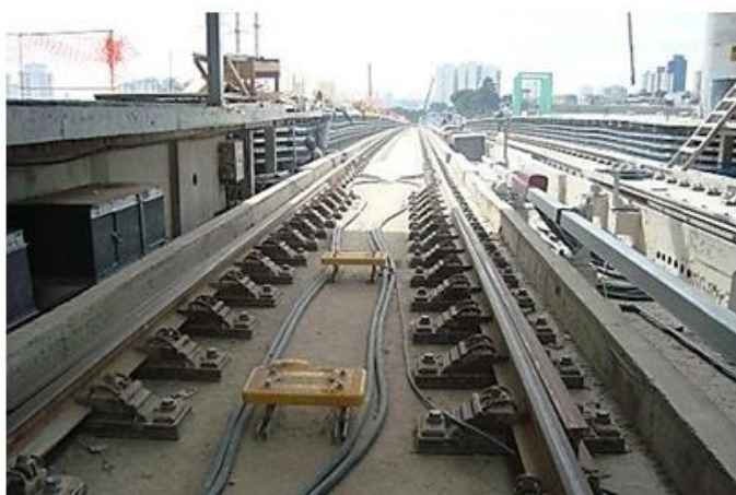
Equipamentos na via