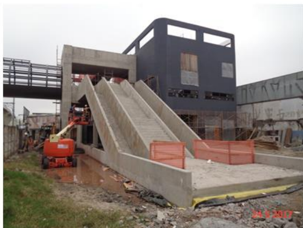
Acabamento do Edifício Técnico Operacional.