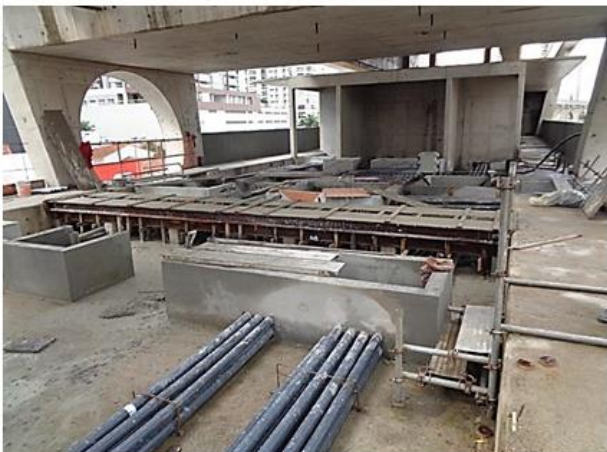
Vista do mezanino da Estação.