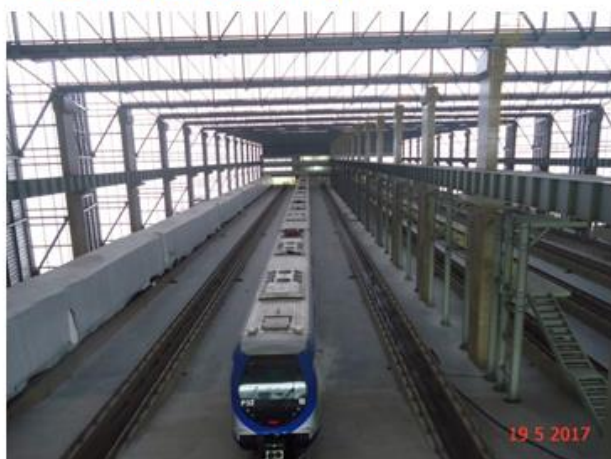
Trens CAF estacionados no Bloco A do Pátio Guido Calói