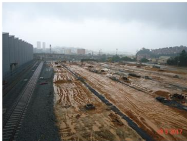
Via Permanente: Infraestrutura em execução.