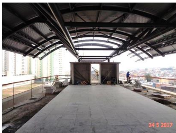
Instalação do piso da plataforma.