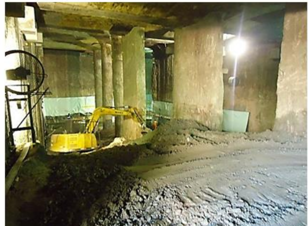
Escavação do acesso de interligação com a Linha 5.