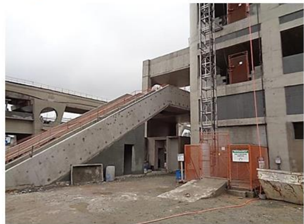
Acesso e Edifício Operacional.