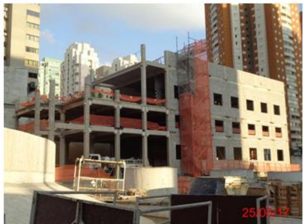
Edifício de salas técnicas: Montagem da estrutura em pré-moldado e acabamento.