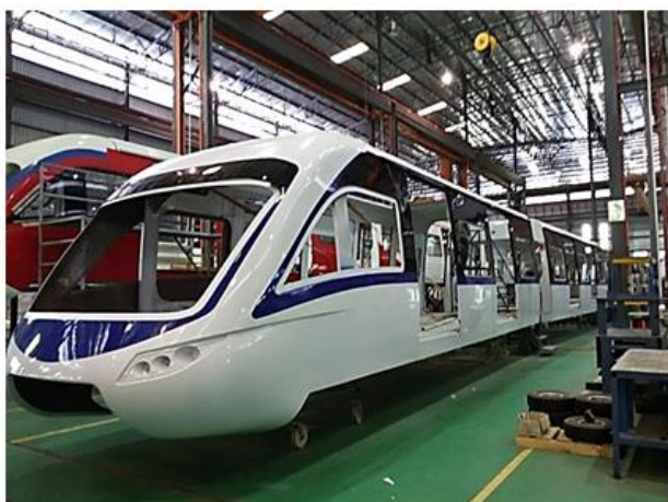
Material Rodante – Contrato em reorganização.