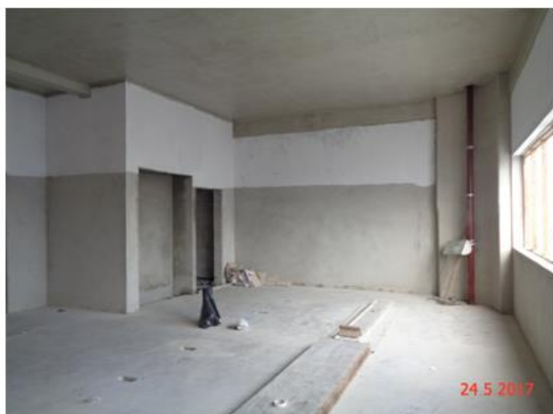
Execução do acabamento das Salas Técnicas.