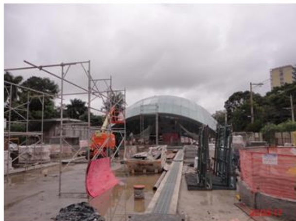
Acesso Principal: Conclusão da instalação dos vidros