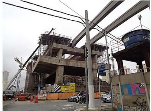
Corpo da Estação.