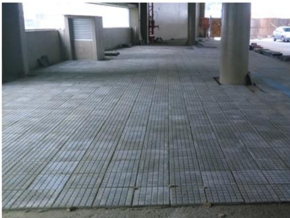
Instalação do ladrilho hidráulico no Terminal Central.