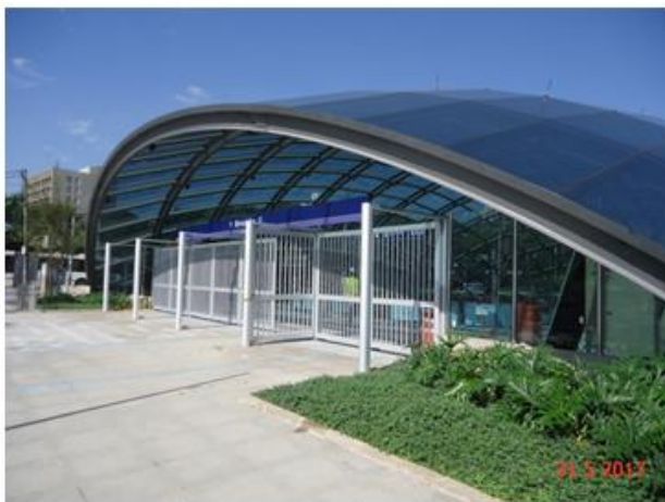
Acesso Principal: Comunicação visual instalada