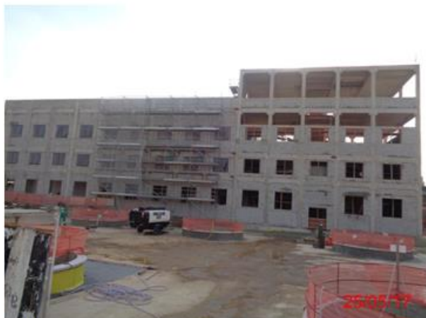
Edifício de salas técnicas: Execução da alvenaria e acabamento.