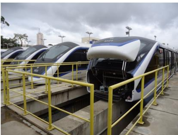
Trens em testes no Pátio Oratório.