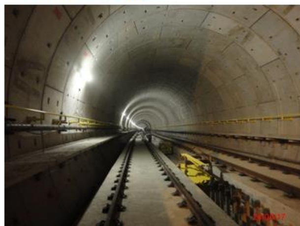
Trecho Chácara Klabin – Dionísio da Costa: Instalação das passarelas de emergência e corrimãos concluídos