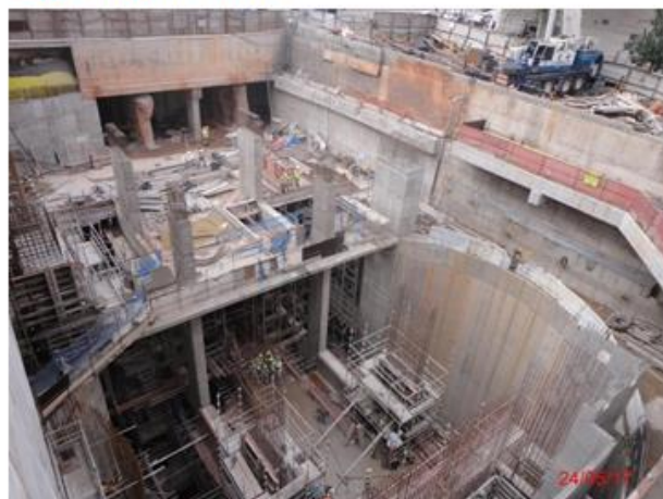
Acesso Principal: Execução das estruturas internas