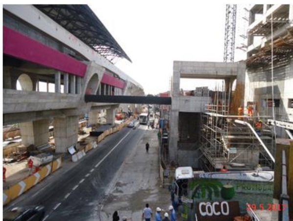
Instalação do passadiço metálico, das telhas da cobertura metálica e da base da passarela do Acesso.