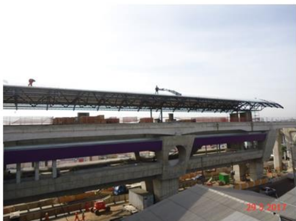
Execução das segunda e terceira camadas da cobertura.