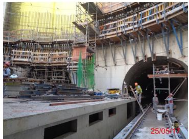
Corpo da estação: Revestimento secundário – Poço 5