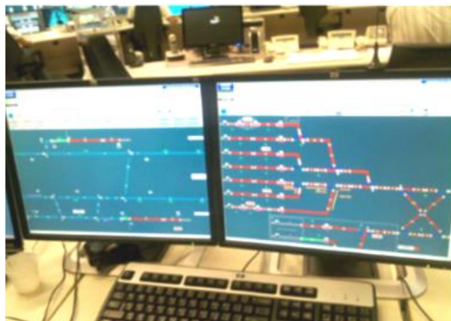
Painel de controle de tráfego