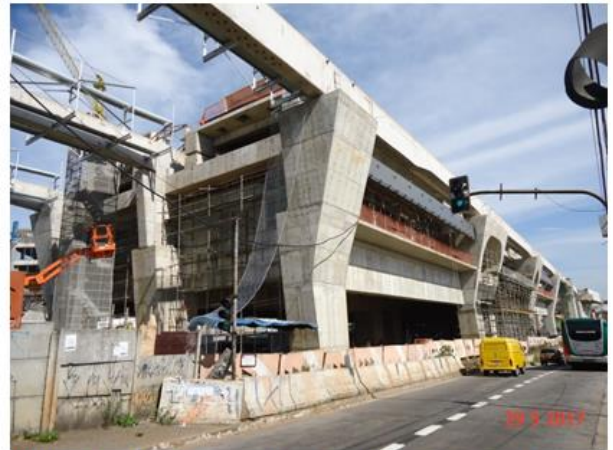
Instalação da passarela de emergência e passadiço.