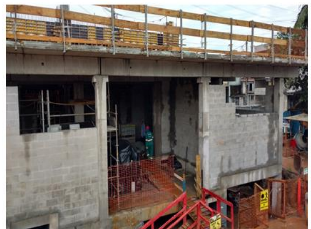
Primeira laje da sala de alta tensão concluída.