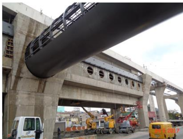
Execução da Sala de Equipamentos Eletrônicos.