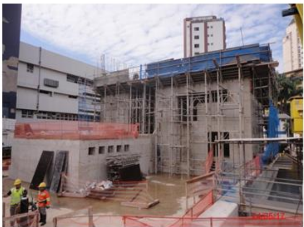
Execução da torre de ventilação e saída de emergência