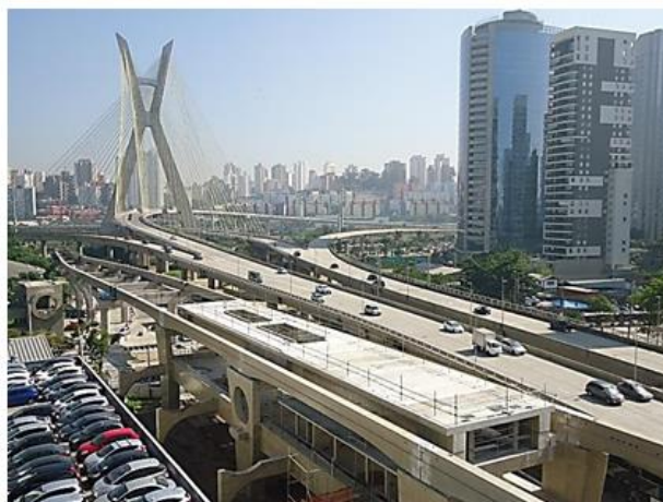
Execução do acabamento do edifício operacional e acesso.