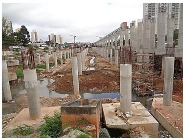
Pátio Água Espraiada – Execução de blocos e pilares.