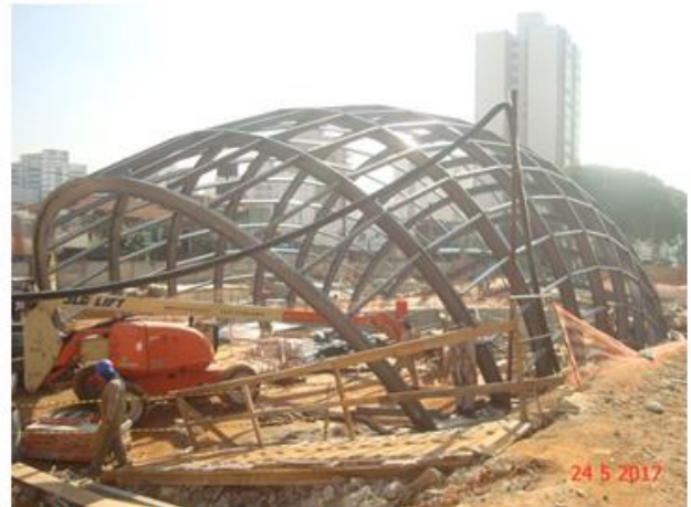
Acesso Principal: Instalação da cobertura metálica