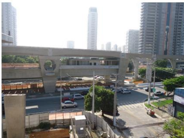
Vista do corpo da Estação.