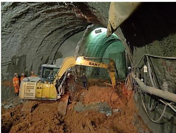
Execução do túnel de acesso ao Aeroporto.