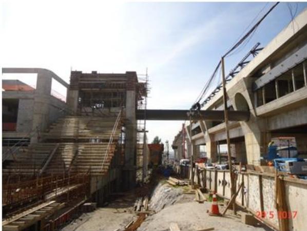
Instalação da passarela, passadiço e cobertura metálica da Plataforma.