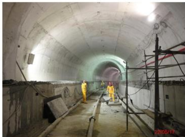
Túnel de estacionamento Via 1: Concluído revestimento secundário