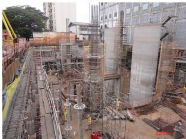
Acesso Sul: Execução das estruturas internas